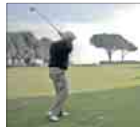
Il circolo Acquasanta

farne parte non basta pagare la quota annuale, oltre duemila euro, e farsi presentare da due soci: bisogna prima acquistare una quota azionaria. Oggi costa intorno ai ventimila euro; ma in caso d'improvvisi ristrettezze, si rivende senza difficoltà. Comunque non bastano neppure il denaro e le conoscenze: è l'atmosfera a scoraggiare i vari furbetti del quartierino. Anche se non costituisce una garanzia assoluta: nella scorsa primavera, il nome del circolo è affiorato nell'inchiesta sulla mega-truffa dei Parioli.