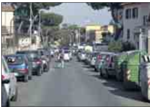
È la strada principale del quartiere: da qualche anno è stato istituito il senso unico, non senza polemiche