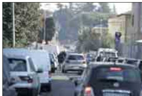
Il traffico da e per l'Appia Pignatelli è costretto su via San Tarcisio, nelle ore di punta è sempre caos