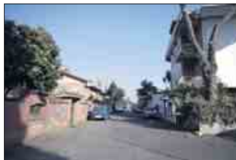
A Quarto Miglio, case con vista sul parco dell'Appia Antica con quotazioni altissime

una vigna; il campo dell'oratorio l'abbiamo spianato noi ragazzini. Per andare e venire c'era solo il tram sull'Appia, stracarico, con la gente appollaiata fuori. Di notte, le baracche pian piano diventavano case in muratura. Il Comune tollerava, purché non si superassero i tre piani: per via della zona archeologica o dell'aeroporto di Ciampino, non si è mai capito bene».